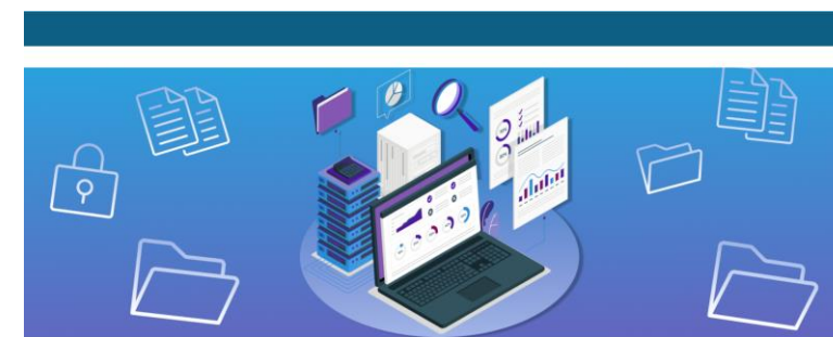
ЭЛЕКТРОННАЯ БАЗА ДАННЫХ ПИСЬМЕННЫХ ЗАПРОСОВ АМФОК

В настоящее время ведется работа над созданием электронной базы данных всех НПА регулирующих деятельность МФО с краткой аннотацией к каждому документу.